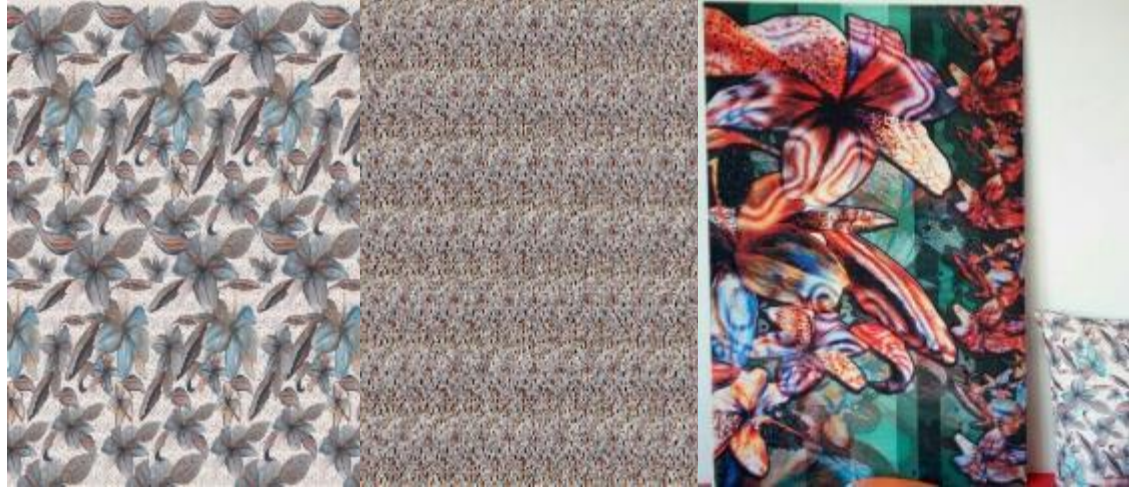
شكل (7) بعض الصور التي توضح بعض التصميمات المطبوعة المنفذه لطلاب قسم المنسوجات بكلية الفنون التطبيقية ( جامعة بدر ) و التي تم توظيفها و مفروشات و خداديات و معلقات و تصلح لان تكون نواه لمشروع صغير ( الطالبه رانيا حسام )