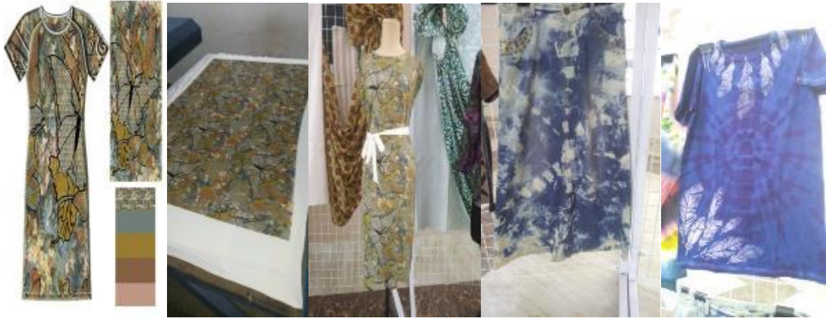
شكل (8) بعض الصور التي توضح استخدام بعض التصميمات المطبوعة اساليب الطباعة لطلاب قسم المنسوجات بكلية الفنون التطبيقية ( جامعة بدر ) و التي تم توظيفها كملابس و مكملات ملابس و تصلح لان تكون نواه لمشروع صغير ( الطالبه رانيا حسام )