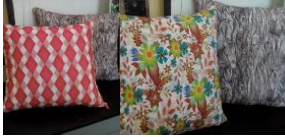
شكل (6) بعض الصور التي توضح بعض التصميمات المطبوعة المنفذه لطلاب قسم المنسوجات بكلية الفنون التطبيقية ( جامعة بدر ) و التي تم توظيفها كمعلقات و مفروشات و خداديات و تصلح لان تكون نواه لمشروع صغير ( الطالب محمود عثمان )