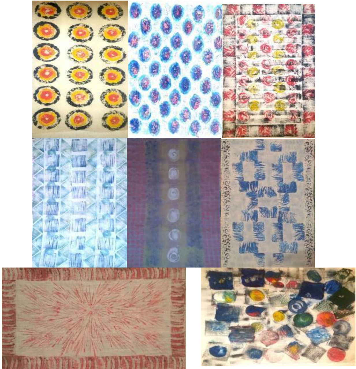
شكل (1) يوضح بعض نتائج لتدريب المتدربين من رواد الأعمال ضمن البرنامج التدريبي ( حضارة تفانين للصناعات الابداعية ) على أساليب الطباعة بأستخدام القوالب و الاستنسل و الرسم المباشر

الملابس و التدريب على طباعة المنسوجات من حيث طرق و اساليب الطباعة و انواعها و علاقتها بصناعة الموضة و الملابس و قد تم ذلك من خلال عمل عدة تجارب عملية للطباعة بالقوالب و الاستنسل و الرسم المباشر لتحقيق قيمة مضافة للملابس و جعلها اكثر تميزاً و تفرداً و ذات خصوصية و اختلاف عن الموجود في السوق بالفعل . و قد قامت الباحثة بتصميم و تنفيذ برنامج التدريب لرواد الأعمال على هذه الطرق ضمن البرنامج التصميمي لمركز التصميمات و الموضة التابع لوزارة الصناعة. و قد تضمن التدريب على حفر القوالب و الاستنسل و الرسم المباشر حوالي (25) ساعة تدريب للتقنيات و اساليب الطباعة لرواد الأعمال الملتحقين بهذا البرنامج التدريبي ثم متابعة لاختيار التصميمات المطبوعة و مدى ملاءمتها لتصميم الملابس تبعاً لاتجاهات الموضة العالمية و كذلك متابعة تنفيذها على الملابس بالاساليب الطباعية التي تم التدريب عليها.