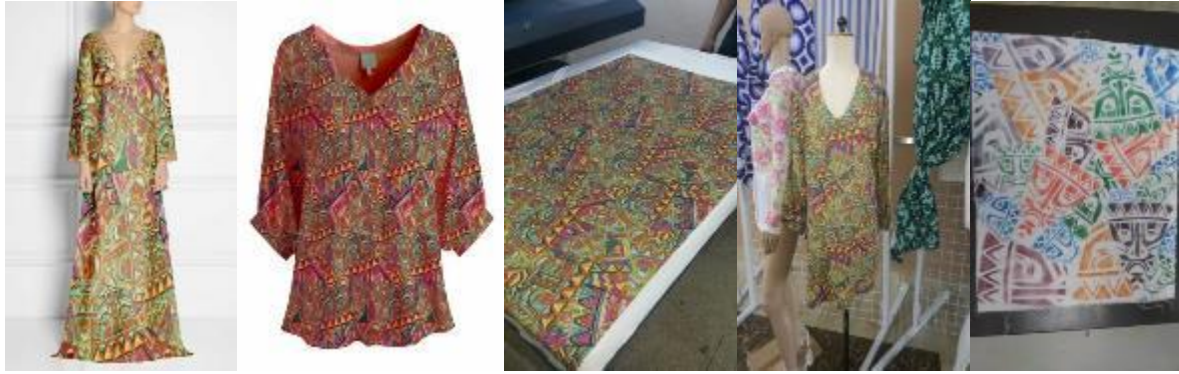
شكل (9) بعض الصور التي توضح استخدام بعض التصميمات المطبوعة اساليب الطباعة لطلاب قسم المنسوجات بكلية الفنون التطبيقية ( جامعة بدر ) و التي تم توظيفها كملايس و مكملات ملايس و تصلح لان تكون نواه لمشروع صغير ( الطالب محمود عثمان )