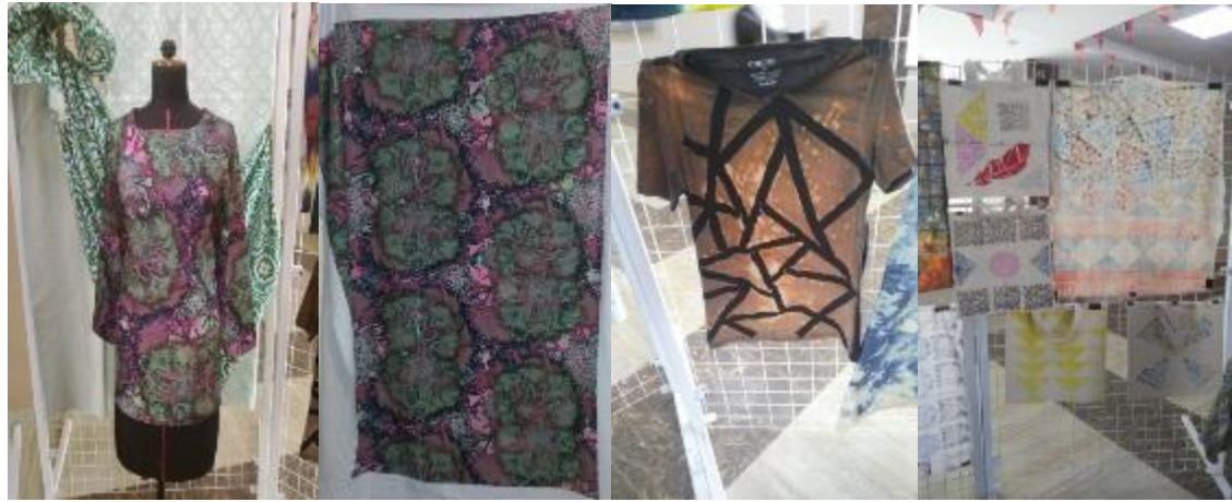
شكل (10) بعض الصور التي توضح استخدام بعض التصميمات المطبوعة اساليب الطباعة لطلاب قسم المنسوجات بكلية الفنون التطبيقية ( جامعة بدر ) و التي تم توظيفها كملايس و شنتط مكملات ملايس و تصلح لان تكون نواه لمشروع صغير ( الطالب محمد مرضى )